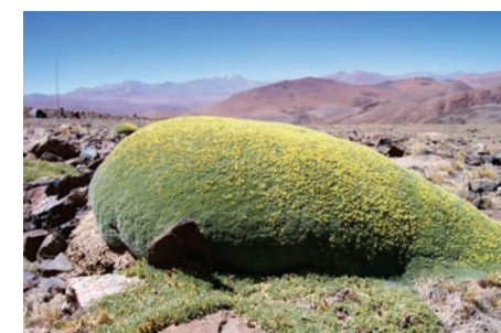
Fig. 2. Llaretas ( Azorella madreporica ) en flor.

El borrador de ficha debe ser entregada en formato digital (.doc o .docx) y las imágenes en formato jpg con buena resolución. El autor puede proponer una diagramación tentativa (en PowerPoint), la que será considerada por la Administración del APP.