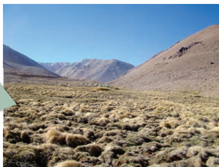
Mapa de Ubicación: sector refugio Samo.