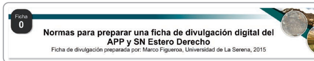
Fig. 1. Detalle del encabezado de la ficha (contiene título, número correlativo y autor de la ficha).

La ficha de divulgación debe tener un título claro (letra Arial tamaño entre 18 y 22 pt). Si el título es muy largo, puede ir en dos párrafos. A la izquierda se indicará un número correlativo. Bajo el título llevará el nombre del autor de la ficha, indicando: "Ficha de divulgación preparada por: Nombre y apellidos, Filiación, año".